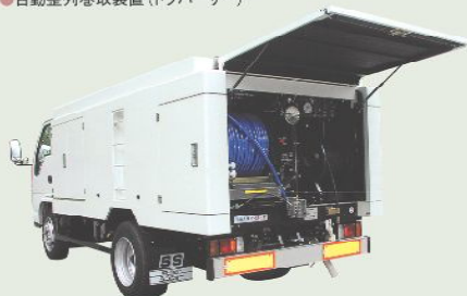
高圧洗浄車 車載型式 PJB-1B68FLP 1年車検