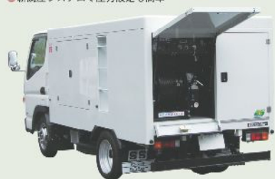
高圧洗浄車 車載型式 RJB-1C36EL 1年車検 RJB-2C36EL 2年車検