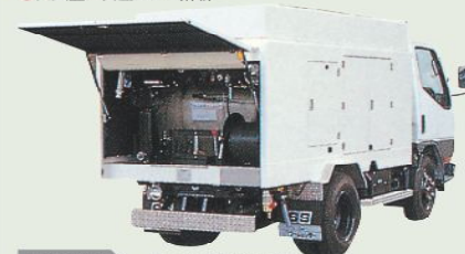
高圧洗浄車 車載型式 PJC-1D36DV 1年車検