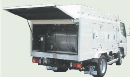
高圧洗浄車 車載型式 PJB-1D32DGV 1年車検