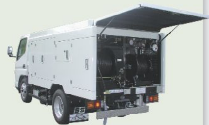
高圧洗浄車 車載型式 PJB-1A45ZS 1年車検 PJB-2A45ZS 2年車検