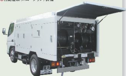
高圧洗浄車 車載型式 PJB-1A68ZS 1年車検 PJB-2A68ZS 2年車検