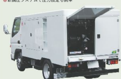
高圧洗浄車 車載型式 RJB-1C17EL 1年車検 RJB-2C17EL 2年車検