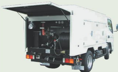
高圧洗浄車 車載型式 PJB-1D40DVP 1年車検