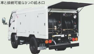
高圧洗浄車 車載型式 PJB-1A68ZP PJB-1A68DP 1年車検 ※設定により45PSも製作可能