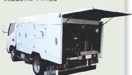
高圧洗浄車 車載型式 PJB-1A62ZS 1年車検 PJB-2A62ZS 2年車検