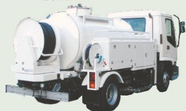
高圧洗浄車 車載型式 PJB-1B116PV 1年車検