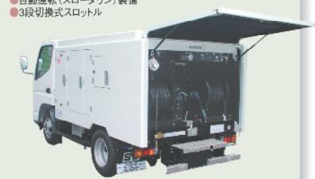
高圧洗浄車 車載型式 PJC-2A36ELS 2年車検