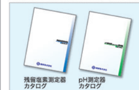
残留塩素測定器カタログ pH測定器カタログ を、ご覧ください。

セットに付属のダイヤル式測定器は[DBo-1-SM]となります。上記以外の測定範囲をお求めのお客様は、別途