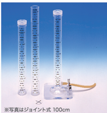
※写真はジョイント式 100cm