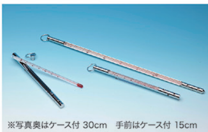
※写真奥はケース付 30cm 手前はケース付 15cm