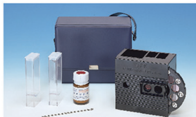
※浄化槽用測定器セット同梱品にはケースは含まれません。